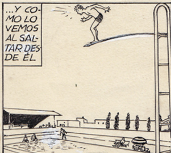
... Y COMO LO VEMOS AL SALTAR DESDE DE ÉL