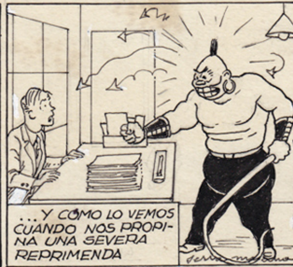
... Y CÓMO LO VEMOS CUANDO NOS PROPINA UNA SEVERA REPRIMENDA