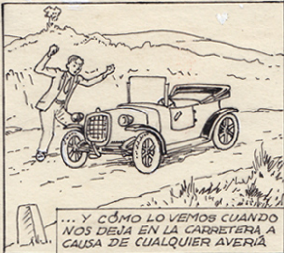
... Y CÓMO LO VEMOS CUANDO NOS DEJA EN LA CARRETERA A CAUSA DE CUALQUIER AVERÍA