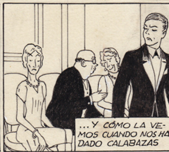
... Y CÓMO LA VEMOS CUANDO NOS HA DADO CALABAZAS