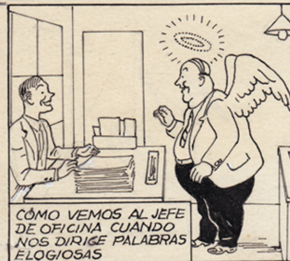
CÓMO VEMOS AL JEFE DE OFICINA CUANDO NOS DIRIGE PALABRAS ELOGIOSAS