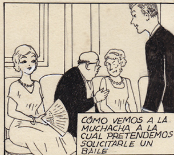
CÓMO VEMOS A LA MUCHACHA A LA CUAL PRETENDEMOS SOLICITARLE UN BAILE